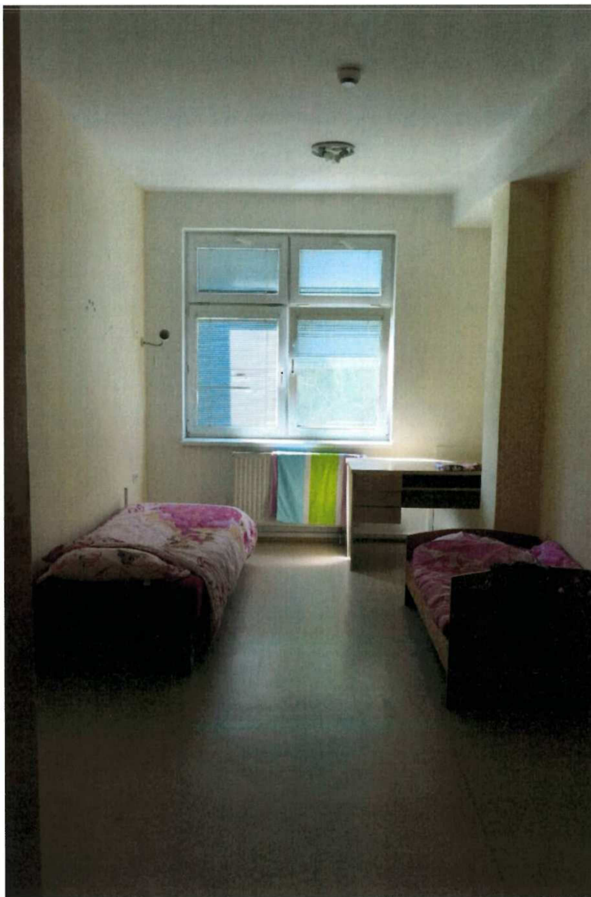
Príloha č. 1- fotodokumentácia izby detí vo výchovnej skupine č. V2